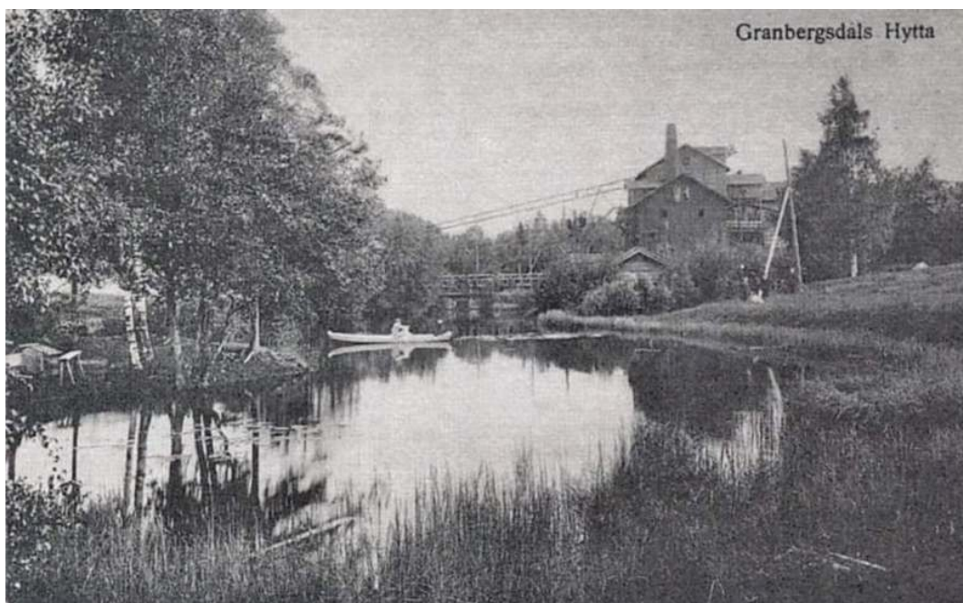
Granbergsdals hytta