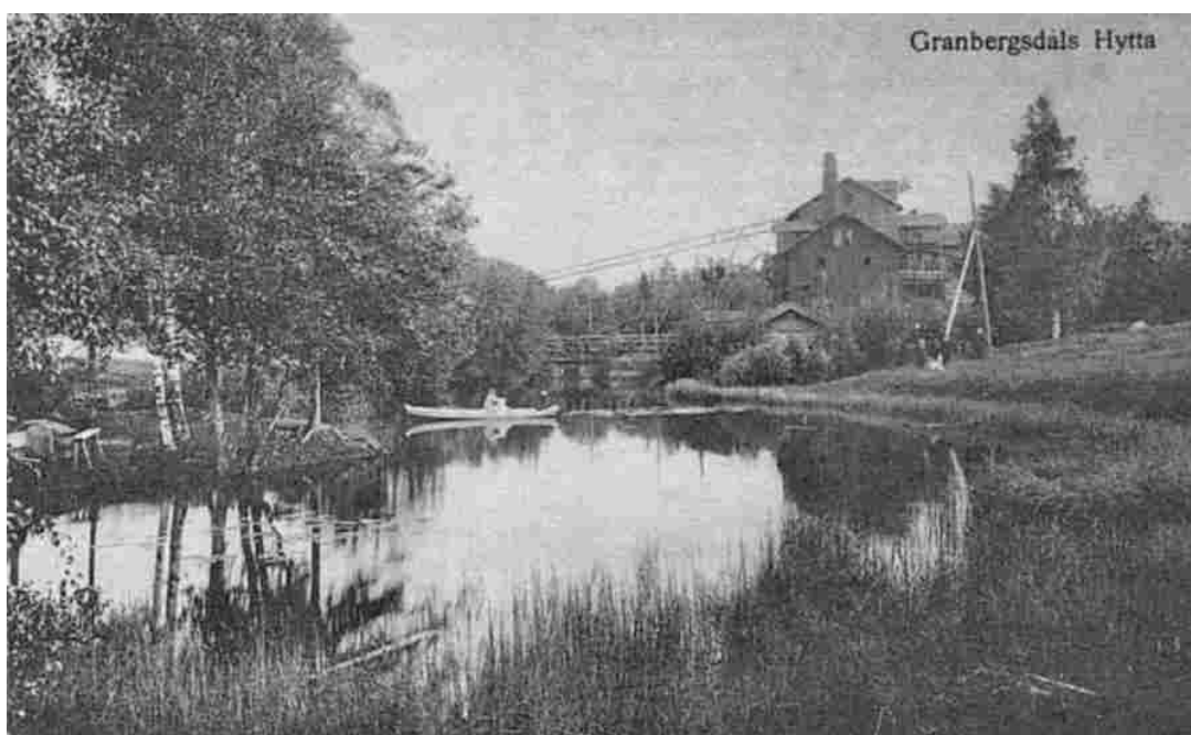
Granbergdals hytta (Lånad bild från Google)