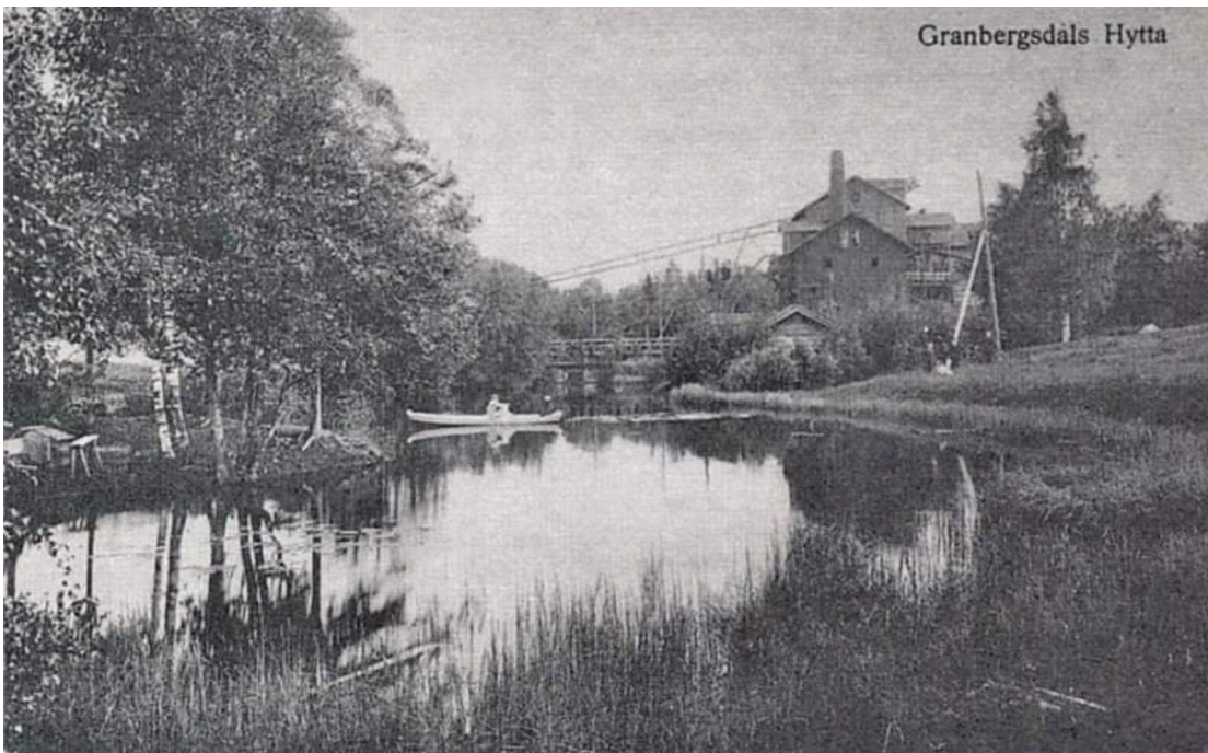
Granbergsdals hytta