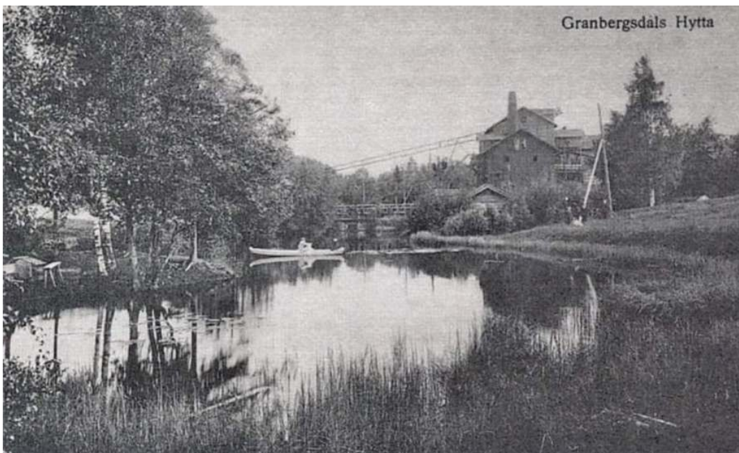
Granbergsdals hytta