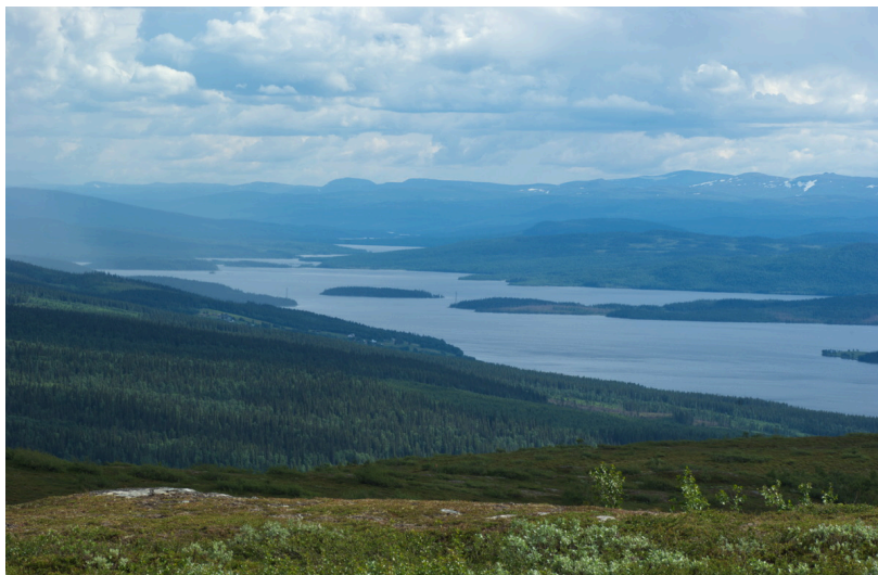
Stora Blåsjön – utsikten mot Jorm med Åre någonstans bortom jordens krökning

fall enligt minnet satt i en båt ute på någon sjö i närheten av Edsåsdalen. Han är numera SM6GT och hör av sig med jämna mellanrum.